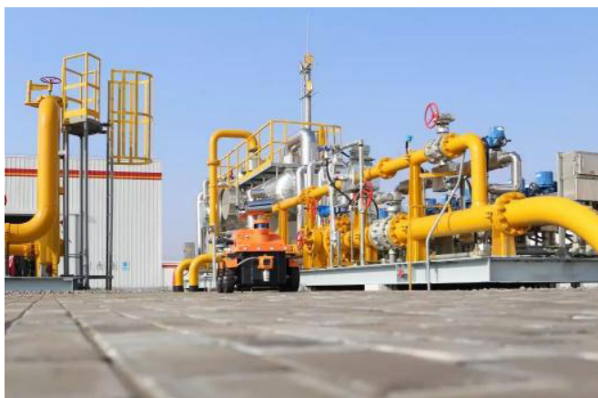
图 1 无人值守站

基于此，我国对天然气管道的建立要足够符合管道运营商的建立需求，以及符合管道运行的控制原则；在天然气管道的设计方面、运行方面等各个阶段、流程需按照国家统一标准来执行。将技术人员的安全性作为首要条件，在实现人员安全的基础上再提升无人值守站的站内运行效率，同时也要定期对无人值守站进行维护和检测。我们在看到其他国家对无人值守站的建立标准时，不难看到他们对“无人值守”定义的理解，以及全力开发远程控制模式的决策力。结合我国国情宜采用“有人值守、无人操作、远程控制”的模式，无人值守站内只有必要的看护人员进行看护，以及少数的专业维护人员。所以，无人值守站要在保障该站能够安全运行的基础上，再来实现天然气管道的有序调控，并由远程操作系统进行电子智能控制，如图 1 所示。