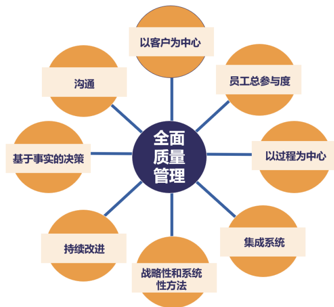
图1 全面质量管理概述

说明了全面质量管理在各个行业的适用性。而化工企业，在积极实践全面质量管理的同时也取得了一定的瞩目成果。山东京博石油化工有限公司通过组织优化、机制建设、管理变革等一系列措施，推动卓越绩效模式与公司管理的深度融合，获得第十八全国质量奖。富海集团新能源控股有限公司以卓越绩效模式整合管理体系，推行全面质量管理，荣获第十九届全国质量奖。以上案例展示了全面质量管理在化工领域的重要意义。