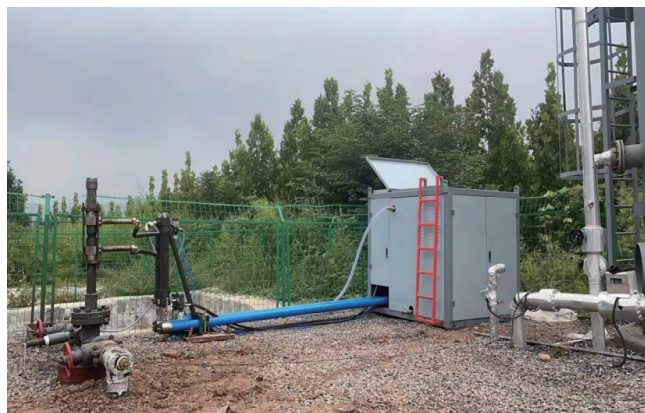
图 3 液压无杆泵排采现场

大井斜 85^\circ \sim 90^\circ 的水平井生产，可携带一定浓度的煤粉，在很多水平井上得到了较好的运用效果，缺点是排水量相对有限 ( \leq 15\text{m}^3/\text{d} )，高负荷运转下，地面驱动系统故障率相对较高。液压无杆泵平均检泵周期可达到 14 个月，运行效果总体较好。具体液压无杆泵排采现场如图 3 所示。