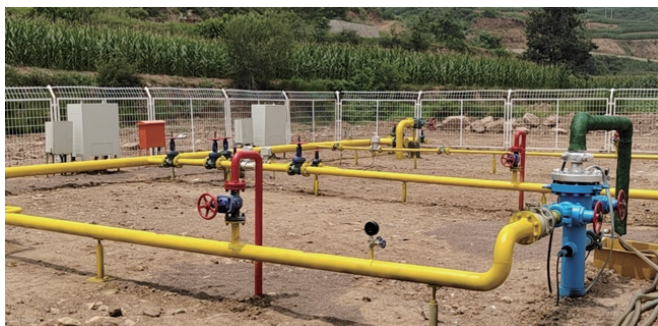
图5 隔膜泵排采现场

隔膜泵通过井下潜油电机驱动隔膜高频震动,将流体源源不断举升出地面,优点是无管杆运动,大井斜适应性强(85°~90°),携煤粉能力强,功率小耗电量低,缺点是产水量相对有限( \leq 10\text{m}^3/\text{d} ),单次检修成本较高。隔膜泵配套人工定期回注制度或回注水设备,可针对煤粉浓度高、与粘土矿物等易形成糊状的水平井使用,从而延长稳定排采周期。通过以上措施,检泵周期可延长稳定至18个月以上。具体隔膜泵排采现场如图5所示。