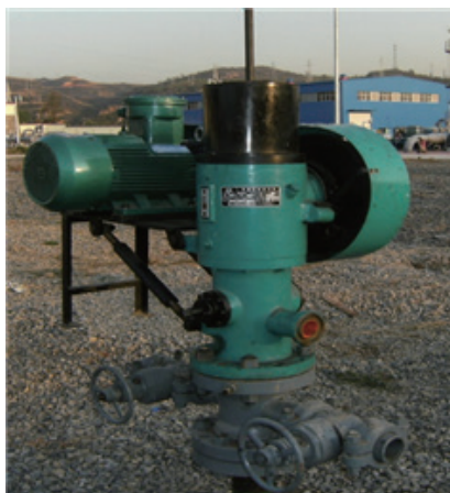
图 2 顶驱螺杆泵排采现场

水平井投运以来，郑庄区块开始大面积使用顶驱螺杆泵。该设备优点是工艺成熟度高，设备成本低、故障率低，产水量调节范围大 ( 0.5\sim 250\text{m}^3/\text{d} )，缺点是管杆相对移动易产生偏磨，在应用过程中需加装油管扶正器（同时保护压力计电缆）和抽油杆扶正器，同时在狗腿度变化大（大于 7^\circ/30\text{m} ）处加装导向器和双保接箍，很大程度上延长了检泵周期。对水平井而言，泵吸入口位置需要同时考虑井斜角不至太大，泵位置所处井段应当以稳斜段为主。通常此状况下平均检泵周期接近 10 个月，当井斜度大于 75^\circ 故障率显著增加，检泵周期缩短至 5 ~ 7 个月，故障主要为卡泵、断杆、油管漏失等。具体顶驱螺杆泵排采现场如图 2 所示。